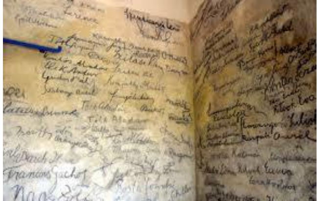
Az előhegyi nyaraló tornácán a kortársak aláírásai

„Mikor elindultunk, még a nagy fények elevenen lobogtak, s épségben állt az Elefántcsonttorony...ki tagadja, hogy gyilkos gázok füstölögnek a laboratóriumokban, s gyilkos ideológiák a lelkekben? ...Esküdjön minden a Kultúra ellen: mi védjük meg legalább az Elefántcsonttornyot, ha már egyéb templomot nem!...Tragikus harc, héroszi irodalom: szemben a korrall, s felülről bírálva az elboruló barbár életet.” (1930.Ezüstkor)