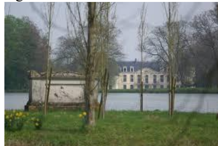
Ermenonville, Rousseau lakhelye