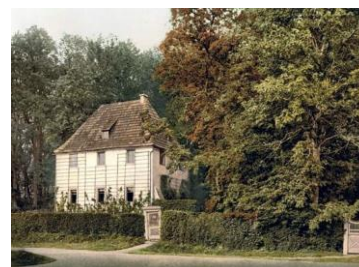
Goethe háza Weimarban