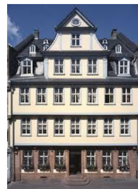
Goethe szülőháza Frankfurtban

Goethe a felvilágosodás, s azon belül a német klasszika legjelentősebb alkotója. Költő, prózaíró és drámaíró, de szépirodalmi művein túl jelentősek tanulmányai és aforizmái is. Sokat elmélkedett a művészet mibenlétéről, esztétikai fejtegetései máig hatóan jelen vannak az irodalmi tudatban. Ő alkotta meg a világirodalom (Weltliteratur) szót, írói témái mindig egyetemeseek: általános, a nemzetin túli élményeket fogalmaz meg. Saját magát világpolgárnak (kozmetopolitának) tartotta, s azt írta: „ Világpolgár vagyok, itt Weimarban honos. ” Nagy hatással volt a magyar irodalomra, többek között Kazinczy Ferenc re, aki hasonló gondolatot fogalmazott meg egyik epigrammájában. „ Nékem az emberiség s Pest-Buda tája hazám. ” Kosztolányi Dezső „olimpuszi szörnyetegnek” nevezte, utalva Goethe már-már isteni nagyságára, és az irigykedő „szörnyeteg” szóval arra, hogy Goethének sikerült az, ami kevés művésznek: egyszerre volt otthon a művészetben és a hétköznapi valóságban is. Ember és költő benne harmóniában élt együtt.